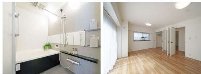
追焚き、浴室乾燥付の快適な浴室