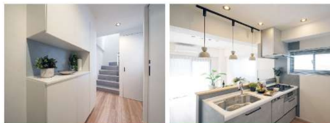
戸建て感覚のメゾネット!