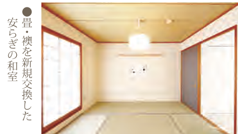
●畳・襖を新規交換した安らぎの和室