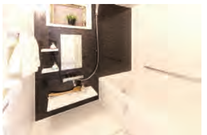
●新規システムバス浴室乾燥機付きです