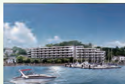
▶ アクアテラス追浜ベイサイドパーク 314号室 価格:2,690万円/専有面積:85.68㎡ 月々約71,059円