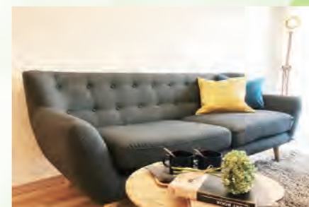
▶ クレール希望ヶ丘 502号室 価格:2,790万円/専有面積:67.82㎡ 月々約73,710円