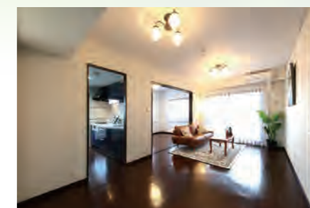
▶ クレストフォルム横浜ポートサイド 708号室 価格:5,190万円/専有面積:75.94㎡ 月々約137,345円