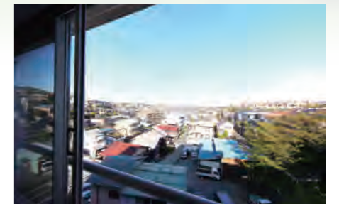
▶ ドルフ弘明寺 502号室 価格: 1,490万円/専有面積: 53.28㎡ 月々約39,241円