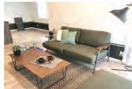
▶ ロイヤルシャトー保土ヶ谷公園 801号室 価格: 1,890万円/専有面積: 83.36㎡ 月々約49,847円