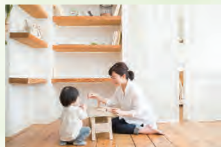
▶ クロニクルレジデンス横浜青葉台 104号室 価格:2,190万円/専有面積:57.64㎡ 月々約57,801円 ※イメージ写真