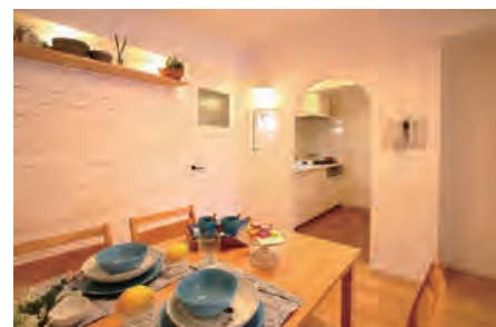
▶ ライオンズマンション六ツ川第5 206号室 価格: 1,590万円/専有面積: 58.00㎡ 月々約41,892円