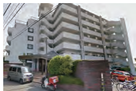
▶ 戸塚グリーンヒルC棟503号室 価格:990万円/専有面積:60.41㎡ 想定利回り約10.3%