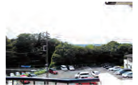
▶ 港南台プリンスハイツ壱号館 402号室 価格: 2,090万円/専有面積: 78.33㎡ 月々約55,150円