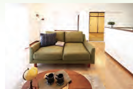
▶ アルス日吉本町イオネス 208号室 価格:4,990万円/専有面積:72.71㎡ 月々約132,042円 ※イメージ写真