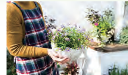
▶ グレイスさがみ野 109号室 価格: 1,490万円/専有面積: 63.00㎡ 月々約39,241円 ※イメージ写真