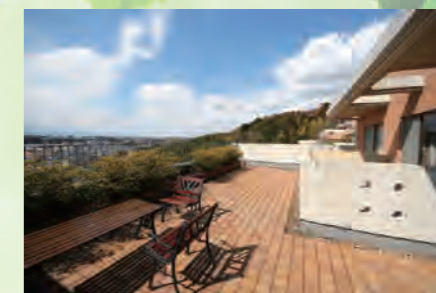
▶ グランテラス戸塚 806号室 価格:2,890万円/専有面積:80.57㎡ 月々約76,362円