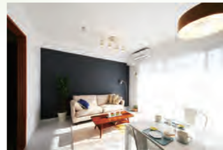
▶ ライオンズマンション西谷 115号室 価格: 1,390万円/専有面積: 53.02㎡ 月々約36,590円