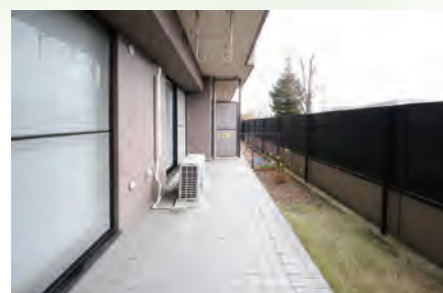
▶ ライオンズガーデン相模大野第2 106号室 価格:2,890万円/専有面積:63.00㎡ 月々約76,362円