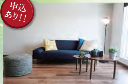
▶ ホーユウビルサイドテラス上星川 803号室 価格:2,190万円/専有面積:74.58㎡ 月々約57,801円