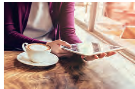
▶ 磯子ニューハイツ 303号室 価格: 1,790万円/専有面積: 63.27㎡ 月々約47,196円 ※イメージ写真