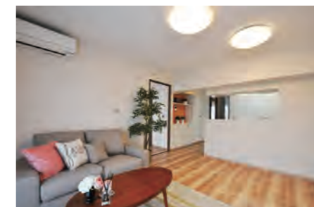
▶ 野庭団地610-2号棟 274号室 価格: 1,790万円/専有面積: 64.72㎡ 月々約47,196円