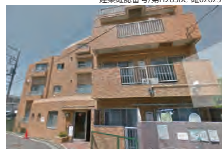
▶ ダイアパレス菅田106号室 価格:990万円/専有面積:50.05㎡ 想定利回り約9.0%