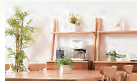
▶ クリオかしわ台式番館 207号室 価格: 1,390万円/専有面積: 50.44㎡ 月々約36,590円 ※イメージ写真