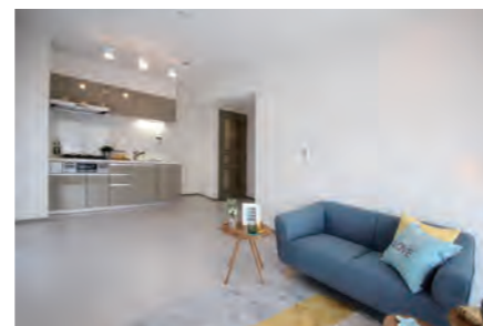
▶ 横浜根岸ダイヤモンドマンション 408号室 価格: 1,690万円/専有面積: 45.02㎡ 月々約44,544円 ※イメージ写真