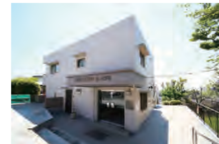
▶ 朝日プラザ上大岡 402号室 価格: 1,990万円/専有面積: 78.65㎡ 月々約52,498円