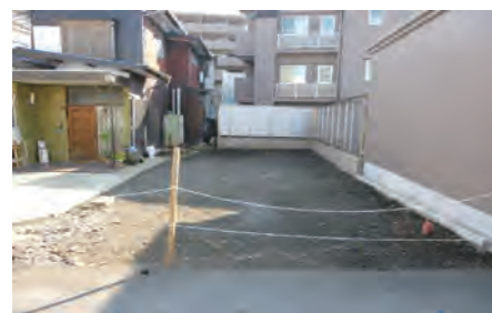
▶ 上星川13丁目土地 価格:2,890万円/土地面積:78.29㎡