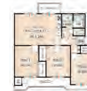
▶ 生田明王台ハイツB棟 402号室 価格: 1,690万円/専有面積: 68.88㎡ 月々約44,544円