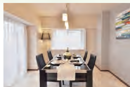
▶ モアクレスト菊名 216号室 価格:3,790万円/専有面積:112.98㎡ 月々約100,225円 ※イメージ写真