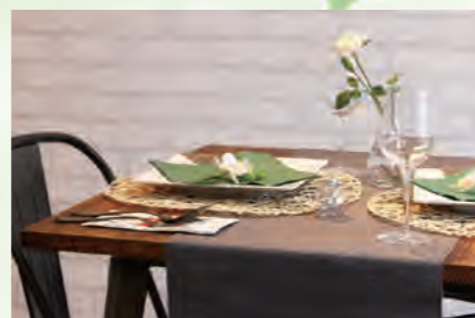
▶ 住友保谷ハウス 127号室 価格:2,690万円/専有面積:60.22㎡ 月々約71,059円