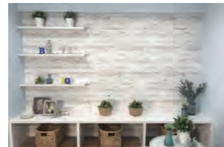
▶ 下永谷フラワーマンション 402号室 価格: 1,790万円/専有面積: 67.64㎡ 月々約47,196円