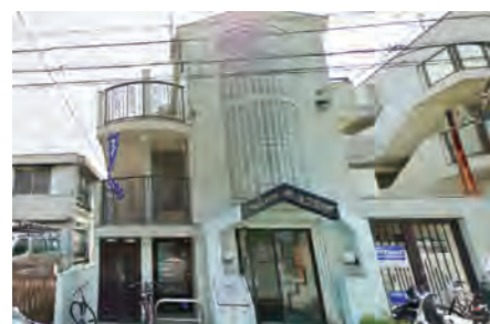
▶ メゾン・ド・フレーズ203号室 価格:590万円/専有面積:16.10㎡ 想定利回り約12.0%