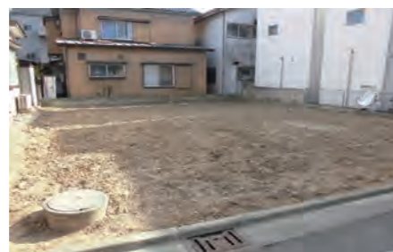
▶ 南加瀬2丁目土地A区画 価格:2,990万円/土地面積:68.07㎡