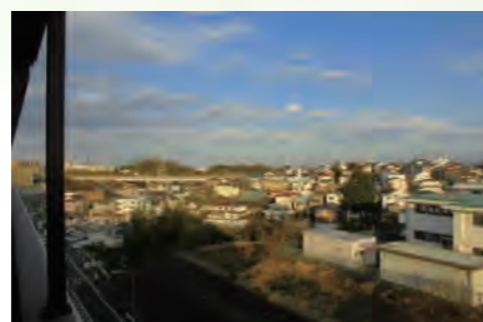
▶ 日神パレスステージ弘明寺 701号室 価格:3,290万円/専有面積:80.41㎡ 月々約84,581円