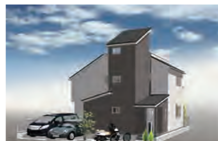
▶ 戸塚区汲沢町戸建 ※イメージパース 価格:3,890万円/土地面積:123.03㎡ 建物面積:98.01㎡ 月々約102,876円 建築確認番号/第H28SBC-確02623Y号