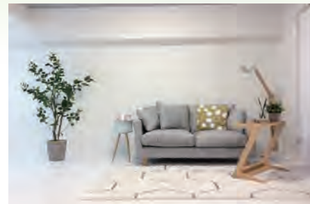
▶ 第二和光ハイツ 103号室 価格: 1,190万円/専有面積: 36.72㎡ 月々約31,287円

キャンペーン期間中にご紹介頂いた方がご契約に至り、物件引渡し完了後のお支払いになります。なお支払いは指定口座にお振込みです。