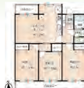
▶ 平塚ニューライフ5号棟 506号室 価格: 1,490万円/専有面積: 68.71㎡ 月々約39,241円