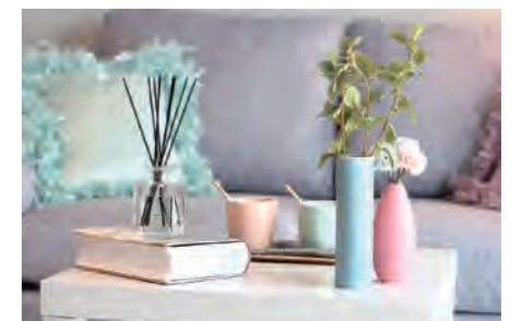
▶ 磯子レインボーハイツ3-1号棟 503号室 価格: 1,790万円/専有面積: 72.85㎡ 月々約47,196円