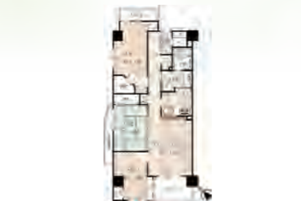
▶ ハイホーム町田 401号室 価格:3,790万円/専有面積:75.92㎡ 月々約100,225円