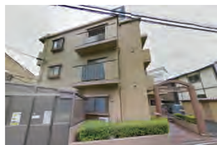
▶ セザール南林間503号室 価格:990万円/専有面積:50.25㎡ 想定利回り約9.4%