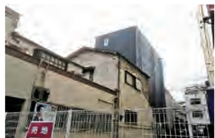
▶ 中区初音町土地 価格:3,490万円/土地面積:67.96㎡