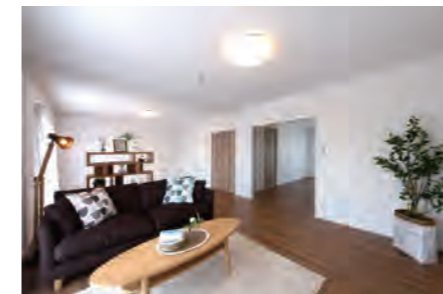
▶ 港南百合ヶ丘ハイツ15号棟 504号室 価格: 1,890万円/専有面積: 78.65㎡ 月々約49,847円